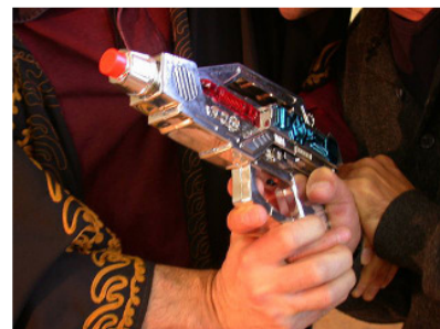
Jack & Harun

Jack & Harun. Ein Theaterstück. wird unterstützt von der Senatsverwaltung für Wissenschaft, Forschung und Kultur.