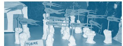
Türme aus dem Architekturprojekt der Zionskirche

1. Advent | 29. November | 19.30 Uhr Sophienkirche: Prüfungskonzert